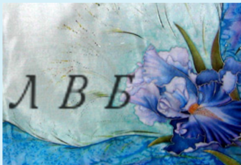
И роспись по шелку эксельсиор контурная техника