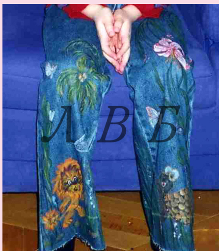
Роспись на джинсах: акварельная техника, но краски акриловые для ткани уквивные фирмы Олки.