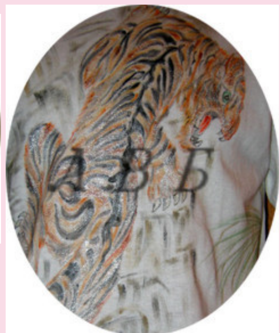
акварельная техника роспись по трикотажу (фабричному) Роспись выполнялась по сухому, красками с загусткой