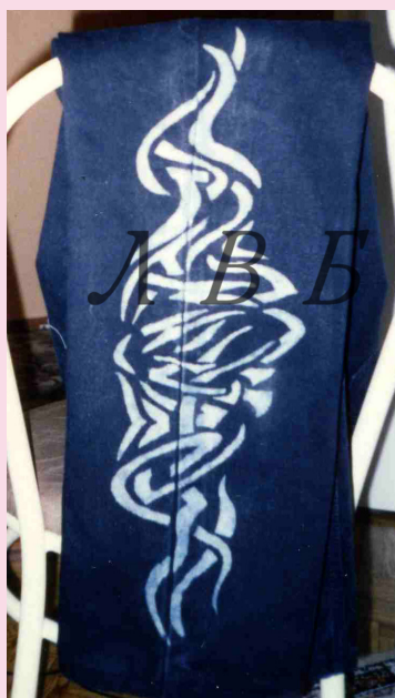
Декорирование испорченных брюк джинсы трафаретной росписью красками металлик.