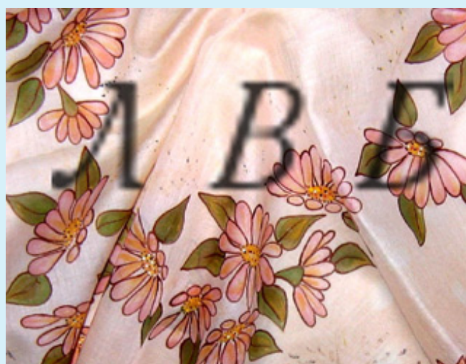
Для примера: роспись на батисте натуральном: акварельная красками с загусткой.